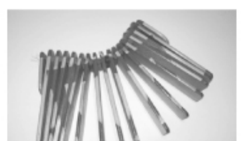
トレシチョートカ