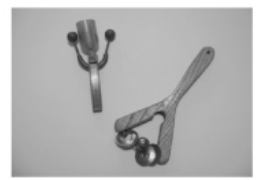
ポグレムーシュカ